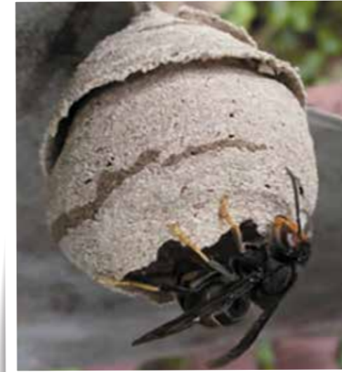
Nid primaire, 10-20 cm de diamètre, suspendu avec une ouverture vers le bas