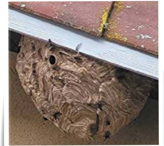
Nid secondaire, jusque 80 cm de diamètre, peuvent se situer dans les arbres, les haies, sous les toits, même sous terre